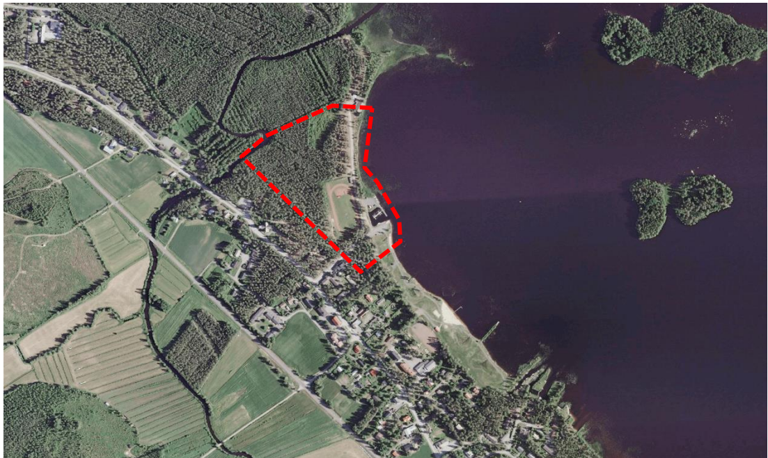
Kuva 1 Suunnittelualue on rajattu likimääräisesti punaisella yllä olevaan kuvaan

Suunnittelualue sijaitsee Lestijärven kirkonkylän tuntumassa Rantatien varrella. Suunnittelualue rajautuu idässä kirkonalueeseen ja lännessä Lestijärveen. Suunnittelualueella sijaitsee vanha urheilukenttä ja venesatama.